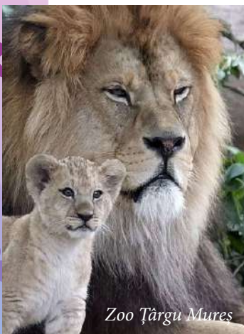
Zoo Târgu Mures

În apropiere, se găsește o altă construcție barocă, fostul sediu al Tablei Regești, forul de apel al Transilvaniei, iar la câțiva pași se află Biserica Unitariană și cea a Ordinului Minorit, închinată Sfântului Anton de Padova.